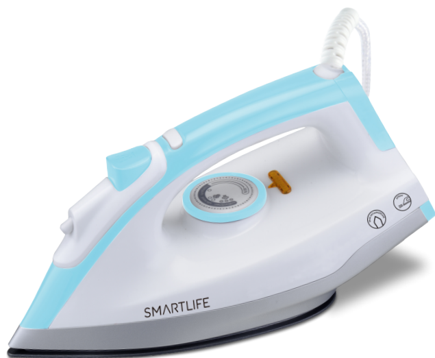
PLANCHA EN SECO MODELO: SL-PL2432D